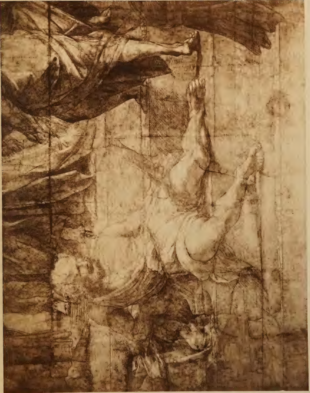
Etude pour le Diogène